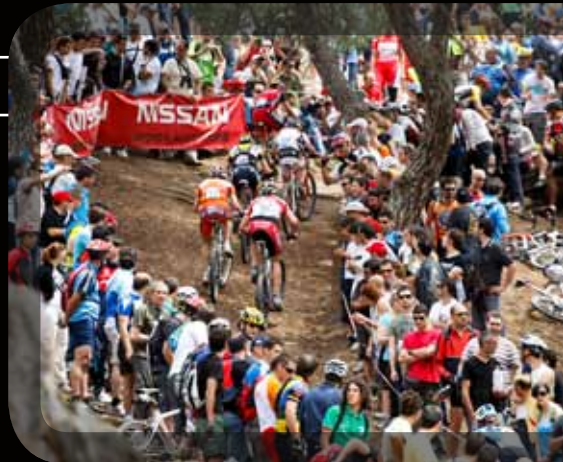
WORLD CUP MADRID